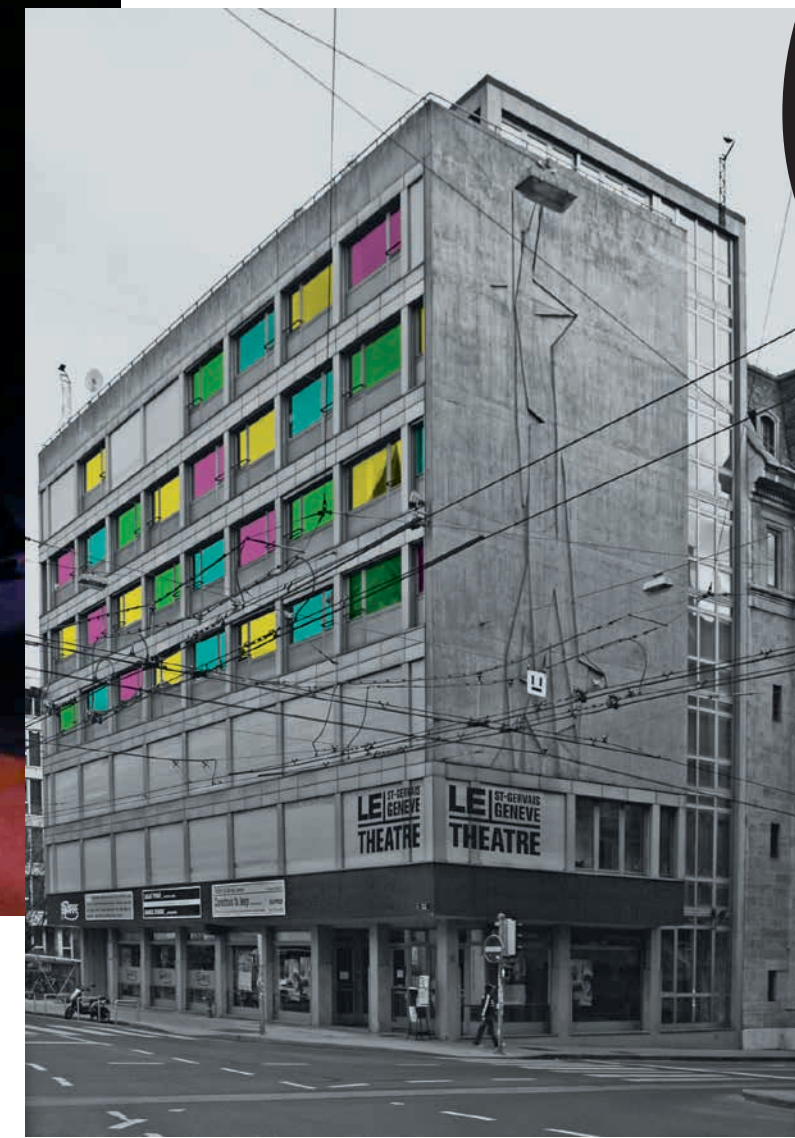
La maison des compagnies